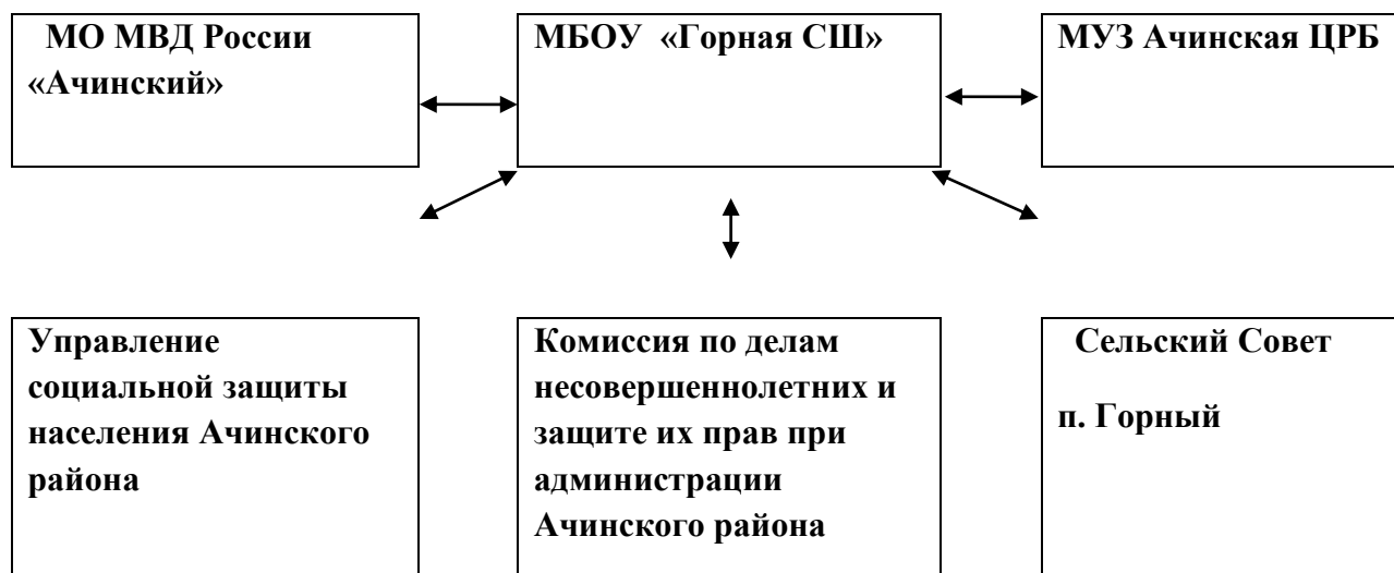
Схема взаимодействия с районными и местными организациями